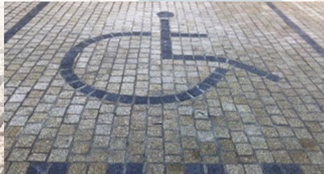
« Joints contrariés, motif parking, pavés sciés »