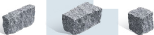
Formats classiques en cm 10x20x5, 10x20x10, 10x10x10, 5x10x10 et 5x5x5.

La fourniture ou fourniture et pose Le terrassement La préparation du chantier La pose du pavage : motifs, type et joints Nos pavés et bordures en granit :